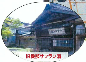
旧機那サフラン酒