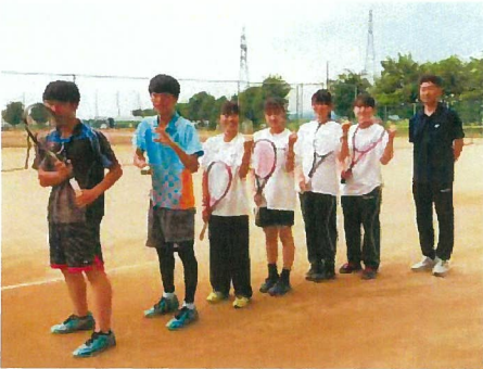
顧問とインターハイ出場メンバー

ソフトテニス部の取材に行ってきた。テニスコートに入った時に生徒さん達が、元気に「こんにちは」の挨拶をしてくれた。私の在学中は「チェス」だったのに、いつ変わったのだろうか。練習も自主的に一生懸命行っているが、とても楽しげに練習をしていたところが印象的だった。昔は先輩から厳しい言葉が飛び交い、緊張感の中での練習だった記憶が残っている。