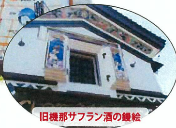
旧機那サフラン酒の線絵