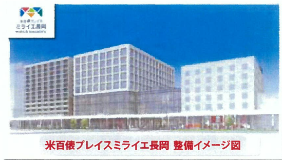
米百俵プレイスマライエ長岡 整備イメージ図