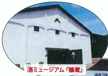
酒ミュージアム『醸蔵』