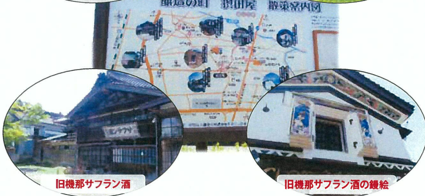
醸造の町 摂田屋 散策案内図