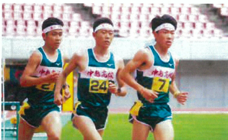
県総体・男子5,000m(於ビッグスワン)