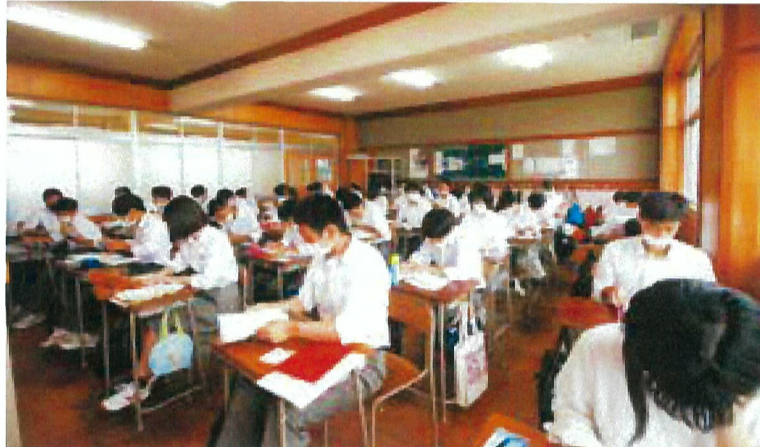
マスクを着用し、授業を受ける様子