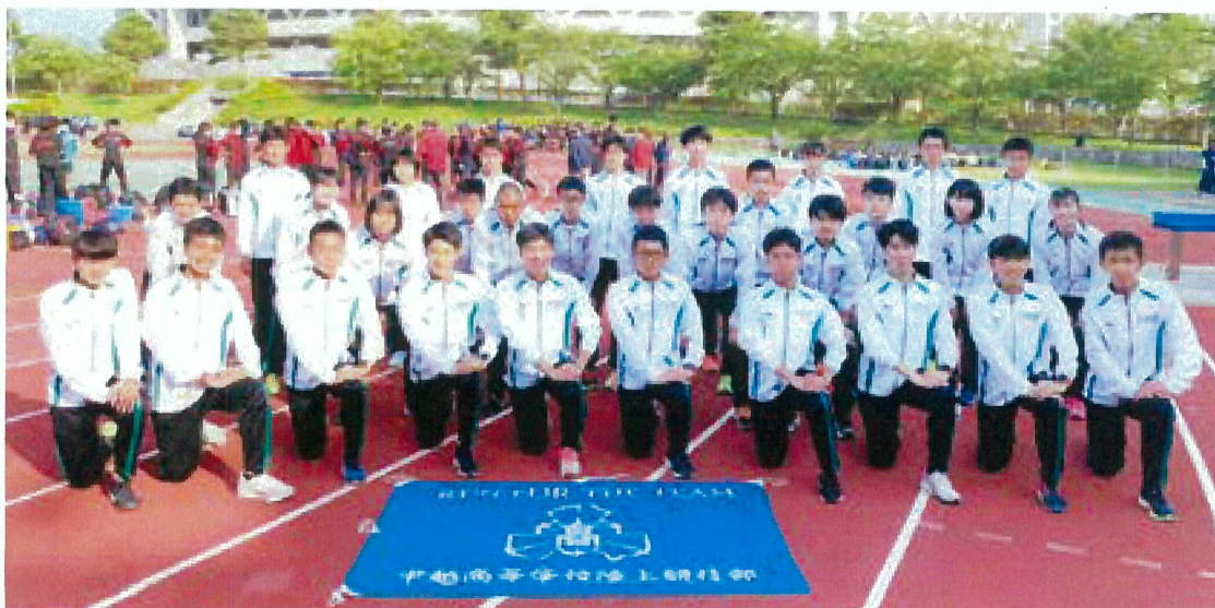
県総体・集合写真

彼らはこれから社会に出て、どんな厳しい状況を迎えても、きっとそれを乗り越えてくれるでしょう。